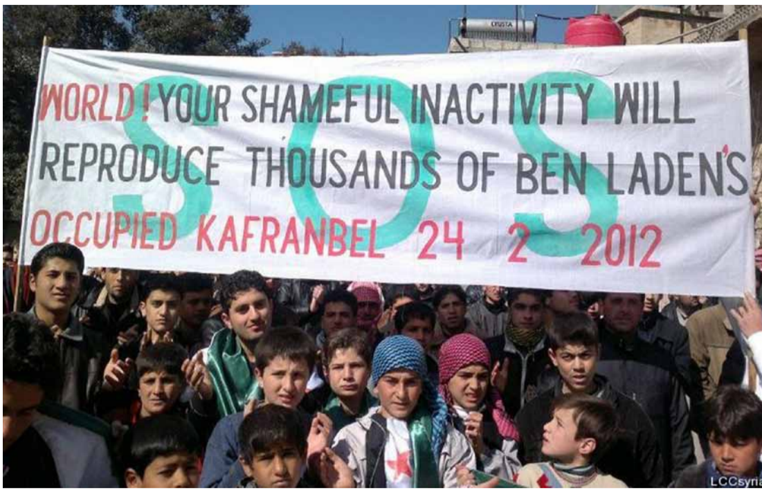
„WELT! EURE SCHÄNDLICHE GLEICHGÜLTIGKEIT WIRD TAUSENDE BIN LADENS HERVORBRINGEN!“ KAFRANBEL 24. FEBRUAR 2012