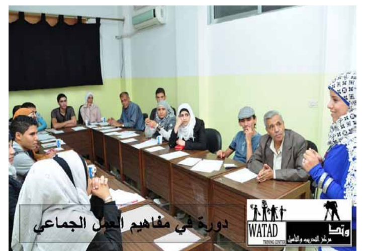
DEMOKRATIE HEISST DIALOG: AKTIVIST_INNEN VERMITTELN IN ZENTREN FÜR ZIVILGESELLSCHAFT WISSEN ÜBER MENSCHEN- UND MINDERHEITENRECHTE UND DISKUTIEREN BETEILIGUNGSMÖGLICHKEITEN.

adopt a revolution unterstützt die Selbstorganisation der AktivistInnen in Yarmouk seit Mitte 2013 und die Arbeit des Watad-Zentrums seit Anfang 2014. Übersetzung: Ansar Jasim