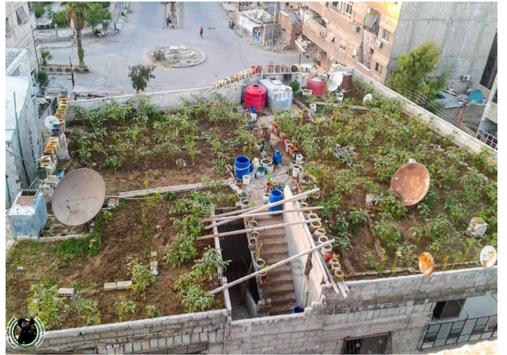
DIE HUNGERBLOCKADEN DURCHBRECHEN: AKTIVIST*INNEN BAUEN GEMÜSE IM STÄDTISCHEN UMFELD AN, UM ES AN BEDÜRFTIGE ZU VERTEILEN.