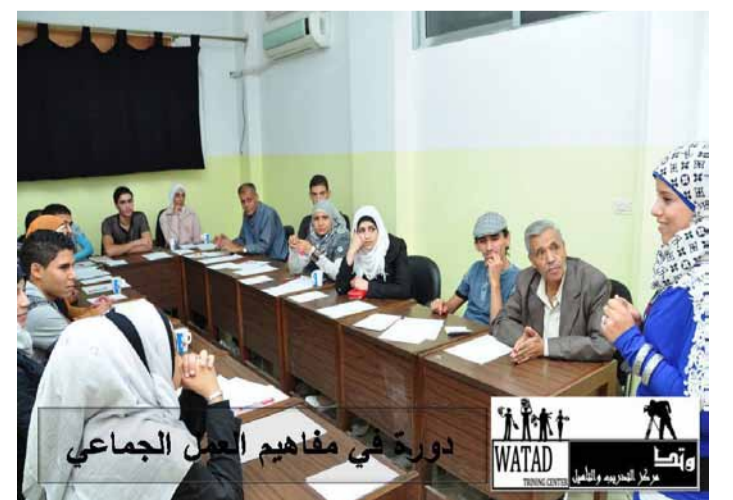
DEMOKRATIE HEISST DIALOG: AKTIVIST_INNEN VERMITTELN IN ZENTREN FÜR ZIVILGESELLSCHAFT WISSEN ÜBER MENSCHEN- UND MINDERHEITENRECHTE UND DISKUTIEREN BETEILIGUNGSMÖGLICHKEITEN.

adopt a revolution unterstützt die Selbstorganisation der AktivistInnen in Yarmouk seit Mitte 2013 und die Arbeit des Watad-Zentrums seit Anfang 2014. Übersetzung: Ansar Jasim