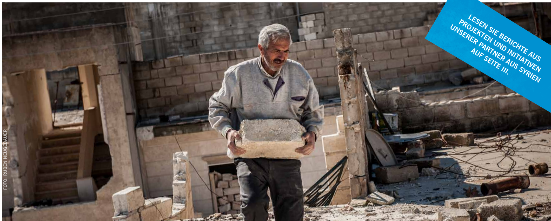
RÄUME SCHAFFEN ZWISCHEN DIKTATUR UND DSCHIHADISTEN: NACH EINEM RAKETENANGRIFF MACHEN SICH DIE BEWOHNER_INNEN BEI ALEPPO SOFORT AN DEN WIEDERAUFBAU.