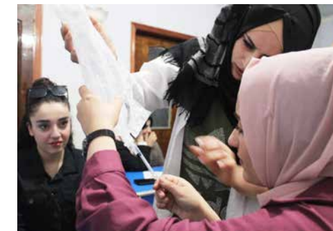
Wegen des Angriffskrieges schult PÊL so viele Menschen wie möglich in erster und medizinischer Hilfe.

Ethnische und religiöse Unterschiede überwinden und Brücken schlagen für eine friedliche Gesellschaft der Vielen – das ist das Ziel der Aktivist*innen des PÊL-Zentrums. Seit Beginn des dritten türkischen Angriffskriegs gegen den Nordosten Syriens im vergangenen November ist es schwieriger, die Gesellschaft zusammenzuhalten, aber auch wichtiger denn je. Deshalb machen sie konsequent weiter.