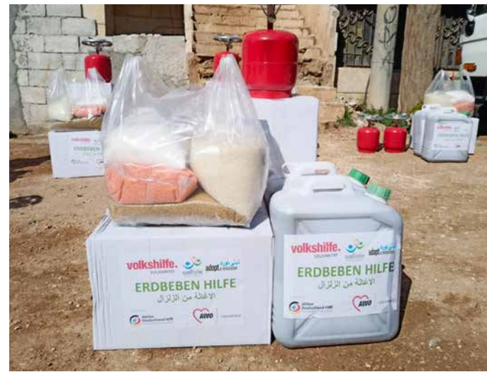
In Säcken und Kartons werden die Hilfsmittel sortiert und verteilfertig an Bedürftige ausgeliefert.