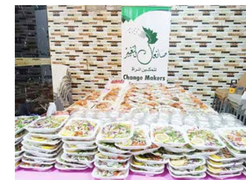
Die Aktivistinnen haben Mahlzeiten für täglich Hunderte Menschen während Ramadan zubereitet

Sie trotzen der Vertreibung und den Repressalien türkisch finanzierter Milizen: Die aus unterschiedlichen Landesteilen nach Nordsyrien vertriebenen Aktivist*innen vom Hooz-Zentrum organisieren Räume, in denen es in Nordwestsyrien einen freien Austausch zu gesellschaftlichen Themen geben kann. Nach den Erdbeben haben sie sofort mit Nothilfe begonnen und zwar nicht nur in Azaz und al-Bab, sondern auch in der benachbarten Stadt Jenderis, weil diese am schlimmsten betroffen und kaum zugänglich war. Dort konzentrierten sie ihre Unterstützung auf besonders marginalisierte Gruppen, wie die kurdischen Bewohner*innen der Stadt. Sie organisieren Medikamente und leisten medizinische Einzelfallhilfe. Gegen die entstehenden neuen Zeltstädte arbeiten sie derzeit an, indem sie tatkräftig beim Wiederaufbau helfen.