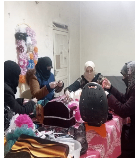
Nach ihrer Näh- und Handarbeitsausbildung bei Sawaedna haben sich diese vier Frauen zusammen selbstständig gemacht

Sie kennen die Region, aber auch die Community der Binnenvertriebenen gut. Dank ihres großen Netzwerks konnten sie nach den Erdbeben schnell handeln. Neben der Verteilung von Hygieneprodukten und Lebensmitteln helfen sie nun Frauen und Kindern in einem Camp dabei ihre traumatischen Erlebnisse im Zuge der Erdbeben zu verarbeiten. Außerdem kooperiert das Frauenzentrum mit Krankenhäusern in Idlib, um Krebspatient*innen eine Behandlung zu ermöglichen, denen nach den Erdbeben die Möglichkeit, ihre teilweise lebensnotwendige Therapie in der Türkei fortzuführen, von türkischen Behörden verwehrt wurden.