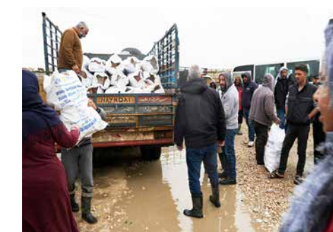
Als es noch ging, versorgten sie syrische Campbewohner*innen u. a. mit Brennholz für den Winter

Eigentlich treiben die Aktivist*innen gemeinsam mit Verbündeten die gesellschaftliche, ökonomische und politische Inklusion von Menschen mit Behinderungen voran. Im Kontext der Erdbeben konnten sich aber auch all jene auf Dhouai al Himam verlassen, die alles verloren hatten. Ob Lebensmittel, Medikamente, Decken, Zelte, Brennstoffe oder Matratzen, die Aktivist*innen organisierten und verteilten, was benötigt wurde.