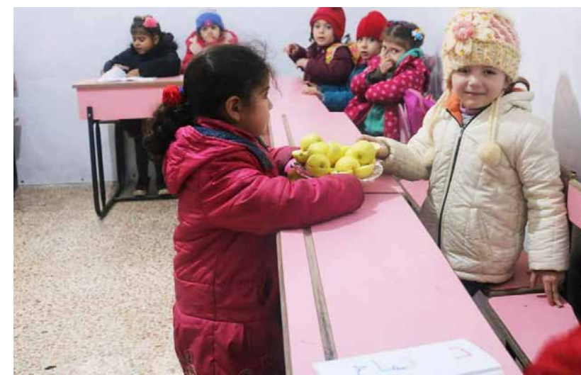
Im Keller können sie einfach mal Kind sein

Die Aktivistinnen setzen sich seit vielen Jahren für Frauenrechte ein. Im Nachgang des Erdbebens sind sie nun aktiv in einem Projekt, das psychische Gesundheit und psychosoziale Unterstützung umfasst, um mentale Langzeitfolgen bei Betroffenen abzumildern.