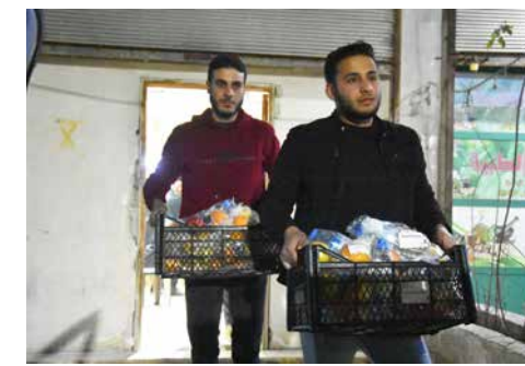
Zentrumsmitarbeiter sind bis spät in der Nacht im Einsatz

Direkt nach den Erdbeben sicherten die Aktivist*innen die Grundversorgung der Überlebenden, indem sie Trinkwasser, Lebensmittel, Decken, Matratzen, Windeln, Babynahrung und Hygieneartikel verteilten. Außerdem koordinierten sie mit Krankenpfleger*innen vor Ort medizinische Hilfe und organisierten Schmerzmittel, Medikamente und weiteres medizinisches Verbrauchsmaterial und -geräte sowie Not-Unterkünfte.