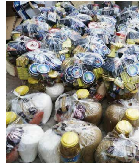
(Über-)Lebenspakete stehen bereit zur Verteilung

Seit den Erdbeben leistet das Team von Sawaedna Nothilfe im Umland von Azaz und Afrin. Von Beginn an organisierten und verteilten sie große Mengen an Hilfsgütern an die Bedürftigen, darunter beispielsweise Decken und Brennstoffe, damit die plötzlich obdachlos gewordenen Menschen nicht erfrieren. Seit die Temperatur milder geworden ist, konzentriert sich das Team auf die Versorgung der Menschen mit Lebensmitteln und Hygieneartikel – denn Katastrophen solchen Ausmaßes sind Nährboden für Krankheiten und Epidemien. Dem wollen sie aktiv entgegenwirken.