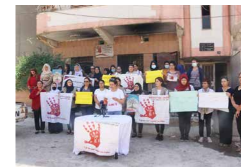
Auch öffentlich sichtbar treten die Aktivistinnen für Frauenrechte ein, hier bei einer Mahnwache

Die Aktivistinnen von Sawiska kennen die Lebensrealitäten und spezifischen Herausforderungen von Frauen sehr gut. In Awareness-Sessions, an denen auch Männer teilnehmen dürfen und sollen, setzen sie sich mit Frauen- und Kinderrechten sowie Femiziden auseinander. Sie leisten wichtige Aufklärungsarbeit im Kampf um die Verteidigung des Rechts auf Leben und Selbstbestimmung.