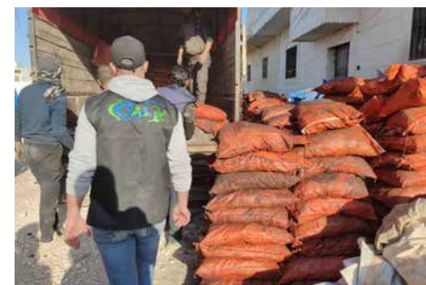
Säckeweise Grundnahrungsmittel wurden LKW-weise in die Nachbarstädte geliefert

Sie trotzen der Vertreibung und den Repressalien türkisch finanzierter Milizen: Die aus unterschiedlichen Landesteilen nach Nordsyrien vertriebenen Aktivist*innen vom Hooz-Zentrum organisieren Räume, in denen es in Nordwestsyrien einen freien Austausch zu gesellschaftlichen Themen geben kann. Nach den Erdbeben haben sie sofort mit Nothilfe begonnen und zwar nicht nur in Azaz und al-Bab, sondern auch in der benachbarten Stadt Jenderis, weil diese am schlimmsten betroffen und kaum zugänglich war. Dort konzentrierten sie ihre Unterstützung auf besonders marginalisierte Gruppen, wie die kurdischen Bewohner*innen der Stadt. Sie organisieren Medikamente und leisten medizinische Einzelfallhilfe. Gegen die entstehenden neuen Zeltstädte arbeiten sie derzeit an, indem sie tatkräftig beim Wiederaufbau helfen.