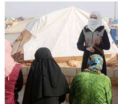
Mitarbeiterin gibt Aufklärungskurs im Camp