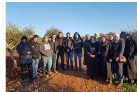
Ein Teil des Verteilteams vom Frauenzentrum

„Frauen für Frauen“ ist das Motto unserer Partnerinnen vom Frauenzentrum Idlib. Von Bildungsangeboten über rechtliche Beratung oder gesundheitliche Aufklärung unterstützen die Aktivistinnen seit Jahren Frauen, Kinder, Ältere, Menschen mit Behinderungen und Binnenvertriebene. Immer wieder leisteten sie in der Vergangenheit auch Nothilfe in den zahlreichen Camps in Idlib.