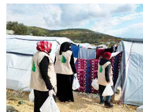
Von Zelt zu Zelt bringen die Change Makers die benötigten Lebens- und Hygienemittel.

Im Fastenmonat Ramadan haben sie ein weiteres Projekt gestemmt: Im „Ramadan-Kitchen“ kochten sie für Hunderte Menschen in den neu entstandenen Zelt-Camps, damit die Familien, denen nichts geblieben ist, wenigstens ihren Fastenmonat begehen konnten und nach dem Fastenbrechen etwas zu Essen sicher hatten.