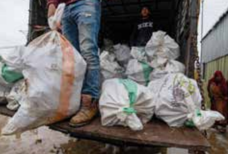
Im Winter frieren die syrischen Geflüchteten in ihren Zelten und Behausungen, im Sommer ist die Hitze kaum zu ertragen. Syrian Eyes versucht die Not zu lindern.

Im Libanon herrscht ein gesellschaftliches und politisches Klima, das syrischen Geflüchteten feindlich und lebensbedrohlich gegenübersteht. Sie besitzen keine Bürgerrechte, oft kein Einkommen und leben größtenteils ohne festes Dach über dem Kopf. Auf den Straßen werden sie von Bürgerwehren gejagt, Tausende werden nach Syrien abgeschoben, wo sie verschwinden, verhaftet, gefoltert oder ins Militär eingezogen werden. Die letzte Unterstützung, die Syrer*innen im Libanon noch haben, sind Aktivist*innen wie die von Syrian Eyes. Diese müssen immer wieder neue Wege finden, um die syrischen Geflüchteten mit Grundbedarfs Gütern wie Wasser, Lebensmitteln oder Heizmaterial im Winter zu versorgen. Diese Arbeit ist lebensnotwendig, aber untersagt. Weil auch eine medizinische Versorgung für die meisten Syrer*innen nicht gewährleistet ist, kümmert sie Syrian Eyes um Menschen, die dringend ärztliche Hilfe brauchen, sich diese aber nicht leisten können. Die Aktivist*innen verstehen sich dabei explizit nicht als »Organisation«, sondern als Netzwerk ohne Hierarchien mit Schwerpunkt auf Selbsthilfe.