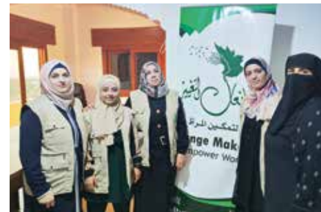
Die Change Maker nehmen ihr Motto so ernst, dass es Teil ihres Logos wurde: Empower Women.

Gemeinsam machen sich die Aktivistinnen von Change Makers gegen geschlechtsspezifische Gewalt und Diskriminierung stark. Gleiche Rechte für Männer und Frauen ist ihr Ziel. Angesichts der vielen weiblichen Binnenvertriebenen und Obdachlosen infolge des Erdbebens leistet das Team mittlerweile speziell feministische Nothilfe. Mehr als 800 betroffene Familien, das sind mehrere tausend Menschen, haben die Change Makers bereits versorgt. Neben humanitären Hilfsgütern verteilen sie auch Seife und Desinfektionsmittel an die bedürftigen Frauen. Denn neben diversen Viruserkrankungen wie Corona kämpfen die Bewohner*innen in den Norcamps mit Cholera und Parasiten wie Kopfläusen.