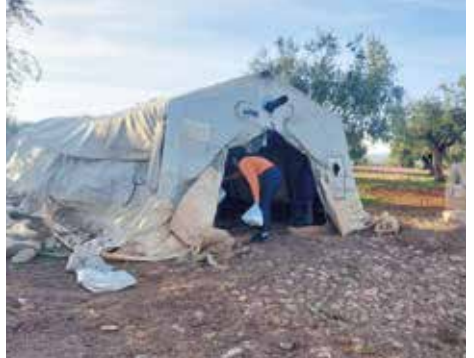
Wenn die Sonne untergeht, wird das Fasten gebrochen. Dafür verteilt eine Aktivistin vom Anbar Zentrum Mahlzeiten.

Für viele syrische Muslim*innen ist der Fastenmonat Ramadan kaum von den restlichen Monaten im Jahr zu unterscheiden – Hunger ist ihr ständiger Begleiter. Da die Menschen in den Zeltcamps oft mental und körperlich erschöpft sind und darüber hinaus kaum Möglichkeiten haben selbst zu kochen, haben mehrere unserer Partner*innen Ramadan-Küchen ins Leben gerufen. Sie bereiten täglich frische Mahlzeiten zu, die sie an die Bedürftigen in den Camps verteilen. So ermöglichen sie ihnen ein nahrhaftes und festliches Fastenbrechen im heiligen Monat. Ganz im Sinne des Ramadans, in dem Solidarität mit jenen an vorderster Stelle steht, die nichts haben.