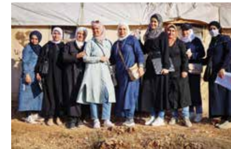
Das Team des Frauenzentrums Idlib

Women Support & Empowerment Center Idlib Idlib-Stadt & Außenstellen im Al-Kana'es und Kafr Takharim Camp in Rif Idlib