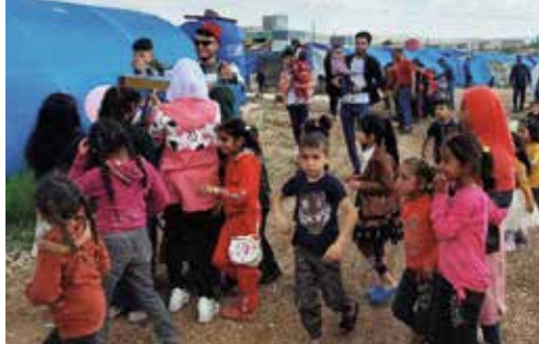
Gerade für die Kinder ist das Leben in Lagern nicht leicht. Die Aktivist*innen schaffen den Raum zum Spielen – hier an Ramadan –, den die Kinder so dringend brauchen.

Die Lebenssituation in Afrin ist für alle Menschen, insbesondere aber für die kurdische Bevölkerung sehr schlecht und von Repression, Isolation und Schikane durch die von der Türkei finanzierten syrischen Milizen geprägt. Aktivist*innen haben deshalb das zivile Zentrum Anbar gegründet, um sichere, diskriminierungsfreie Räume zu schaffen. Besonders Kinder und Jugendliche verschiedener Bevölkerungsgruppen sollen sich hier frei von Angst und Vorurteilen begegnen, kennenlernen, austauschen, vernetzen und zusammenarbeiten. Aber auch alle anderen Altersstufen sind willkommen. Die Aktivist*innen wollen so aktiv den gesellschaftlichen Zusammenhalt fördern. Seit den Erdbeben leistet das Anbar-Zentrum außerdem psychosozialen Support sowie dringend benötigte Nothilfe für die Überlebenden in den Camps. Ihre Hilfe ist unabhängig und diskriminiert nicht, wie die türkischen und pro-türkischen Akteur*innen vor Ort.