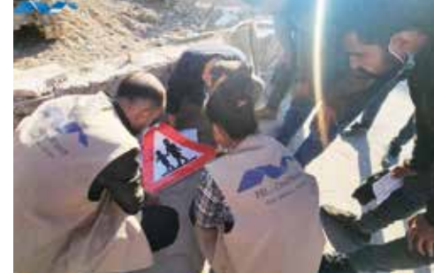
PÊL übernimmt Verantwortung für die Gemeinschaft und sorgt für die Sicherheit aller, indem die Aktivist*innen eigenständig Verkehrschilder anbringen, wo die Behörden versagen.

Qamishli, Hassaka, Tîrbespi/al-Qahtaniyya, Raqqa