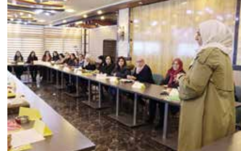
In Dialogrunden und Workshops wird über Gleichberechtigung, Frauenrechte, Arbeitsbedingungen und -möglichkeiten und vieles weitere diskutiert.

Als das Assad-Regime die Revolution im Jahr 2011 brutal niederschlug, ahnten die drei Gründerinnen, dass sich die Situation besonders für Frauen und Kinder verschlechtern würde. Kurzerhand riefen sie das Frauenzentrum Sawiska nahe der türkischen Grenze ins Leben, das bis heute eine wichtige Institution für Frauen in der Region ist. Die Aktivistinnen unterstützen Betroffene von Vertreibung und Krieg. Das Zentrum fungiert als Anlaufstelle, Schulungs- und Basis für die zahlreichen Aktivistinnen,