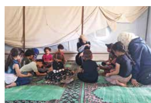
Flüchtlingslager statt Schule, Bomben statt Bildung, Angst statt ausgelassene Kindheit – das ist die Lebensrealität vieler Kinder in Nordwestsyrien. Die Aktivistinnen von KLYA versuchen mit psychosozialen Support und viel Geduld die betroffenen Kinder auf die Zukunft vorzubereiten.