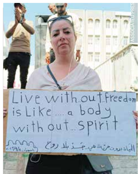
Eine Demonstrantin in Suweida im September 2023: Die Proteste gegen das Assad-Regime dauern bis heute an.

Die Lebenssituation in Afrin ist für alle Menschen, insbesondere aber für die kurdische Bevölkerung sehr schlecht und von Repression, Isolation und Schikane durch die von der Türkei finanzierten syrischen Milizen geprägt. Aktivist*innen haben deshalb das zivile Zentrum Anbar gegründet, um sichere, diskriminierungsfreie Räume zu schaffen. Besonders Kinder und Jugendliche verschiedener Bevölkerungsgruppen sollen sich hier frei von Angst und Vorurteilen begegnen, kennenlernen, austauschen, vernetzen und zusammenarbeiten. Aber auch alle anderen Altersstufen sind willkommen. Die Aktivist*innen wollen so aktiv den gesellschaftlichen Zusammenhalt fördern. Seit den Erdbeben leistet das Anbar-Zentrum außerdem psychosozialen Support sowie dringend benötigte Nothilfe für die Überlebenden in den Camps. Ihre Hilfe ist unabhängig und diskriminiert nicht, wie die türkischen und pro-türkischen Akteur*innen vor Ort.