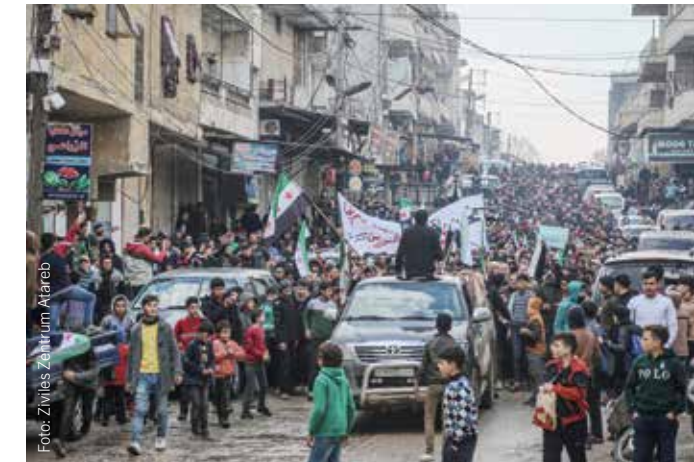
Aktuelle Bilder aus verschiedenen Regionen in Syrien, die an 2011 erinnern: Seit Februar gibt es in Idlib Massendemonstrationen gegen die islamitische Miliz HTS. In Suweida gehen die Menschen bereits seit vergangemem Oktober gegen das Assad-Regime auf die Straße – der berechtigten Angst vor Gewalt und Repression zum Trotz.

In der Türkei und dem Libanon führt staatliche Diskriminierung dazu, dass regelrecht Jagd auf Geflüchtete gemacht wird. Beide Länder schieben bereits zwangsweise Syrer*innen in hoher Zahl ab. Die EU unterstützt sie mit Milliarden schweren Flüchtlingsdeals.