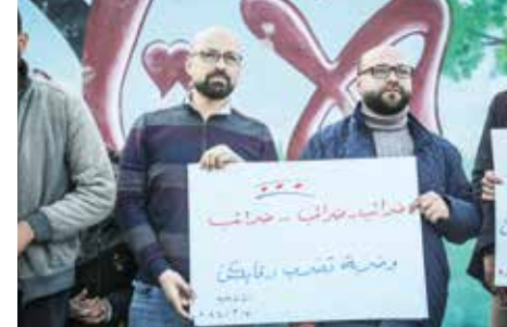
Aktivistinnen des zivilen Zentrums Atareb bei einer Demo im Februar 2024: »Steuern und Schläge in den Nacken« steht auf dem Plakat. Die Menschen fühlen sich von der HTS-Miliz ausgenommen und gepeinigt.

Das zivile Zentrum Atareb bringt unter schwierigsten Bedingungen das zivilgesellschaftliche Leben Atarebs voran. Die Ziele: Austausch, Partizipation, politische Bildung – Milizenherrschaft und den anhaltenden Angriffen des Assad-Regimes zum Trotz. Immer wieder lehnen sie sich auch gegen die Herrschaft der radikal-islamistischen HTS auf. Das Zentrum hat sich aktiv an den aktuellen, weitreichenden Protesten in Idlib beteiligt, die sich gegen die HTS richten, um die Freilassung aller Gefangenen und umfassende Reformen zu fordern. Die Aktivist*innen lehnen das zentrale Verwaltungssystem sowie