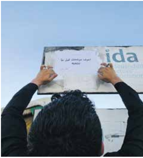
»Informiere dich über deinen Kandidaten, bevor du wählst!« Aufklärungskampagne des zivilen Zentrums Atareb anlässlich der Parlamentswahlen 2025.