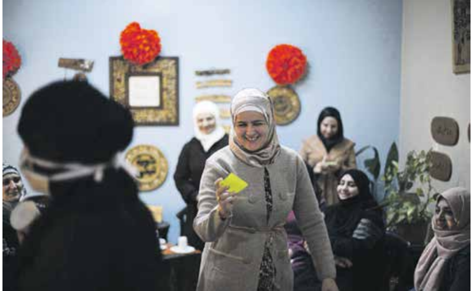
Im Women Support and Empowerment Center in Idlib stärken Frauen sich gegenseitig in ihrem Kampf um Gleichberechtigung und Teilhabe, wie bei der aktuellen Kampagne gegen geschlechtsspezifische Gewalt.

Als die großen Proteste abnahmen, arbeitete ich mit besonders verletzlichen Kindern in Notunterkünften und auf der Straße. Viele hatten ihr Zuhause und jede Sicherheit verloren. Es war eine Form des Widerstands im Kleinen, in einer Zeit, in der offener Protest kaum noch möglich war. Doch auch hier blieb ich angreifbar: Einschüchterungen und Belästigungen durch die Geheimdienste des Assad-Regimes trafen mich als