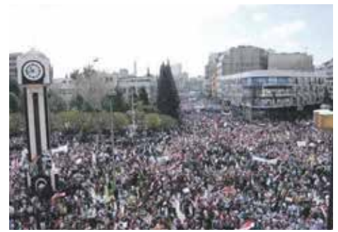
Protest in Homs 2011

Alaa engagierte sich früh im zivilen Widerstand und arbeitet heute bei Seen for Civil Peace in Homs. Ihr Einsatz steht in der Tradition der Revolution von 2011: für Dialog, Gewaltprävention und Gerechtigkeit.