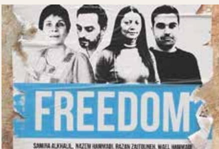
Kampagne 2014 anlässlich des Verschwindens von Razan Zaitouneh, Samira al-Khalil, Wael Hamadah und Nazim al-Hamadi