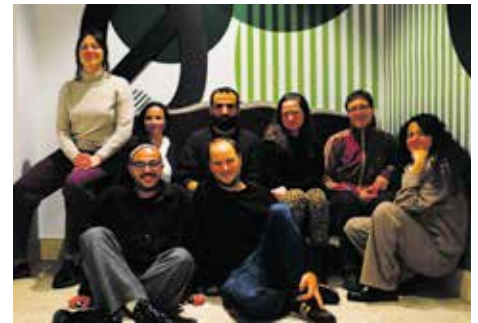
Das Team von Adopt a Revolution 2026