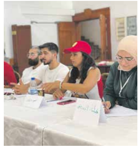
Dialogrunde in Lattakia, bei der Hooz Menschen aus unterschiedlichen Regionen zusammen bringt, um über Vorurteile und Zukunftsvisionen zu sprechen.