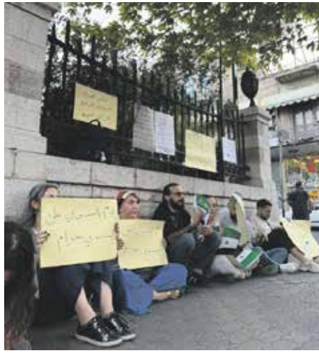
Unsere Partner*innen bei Protesten vor dem Parlament in Damaskus anlässlich der Gewalteskalationen in Suweida im Juli 2025.